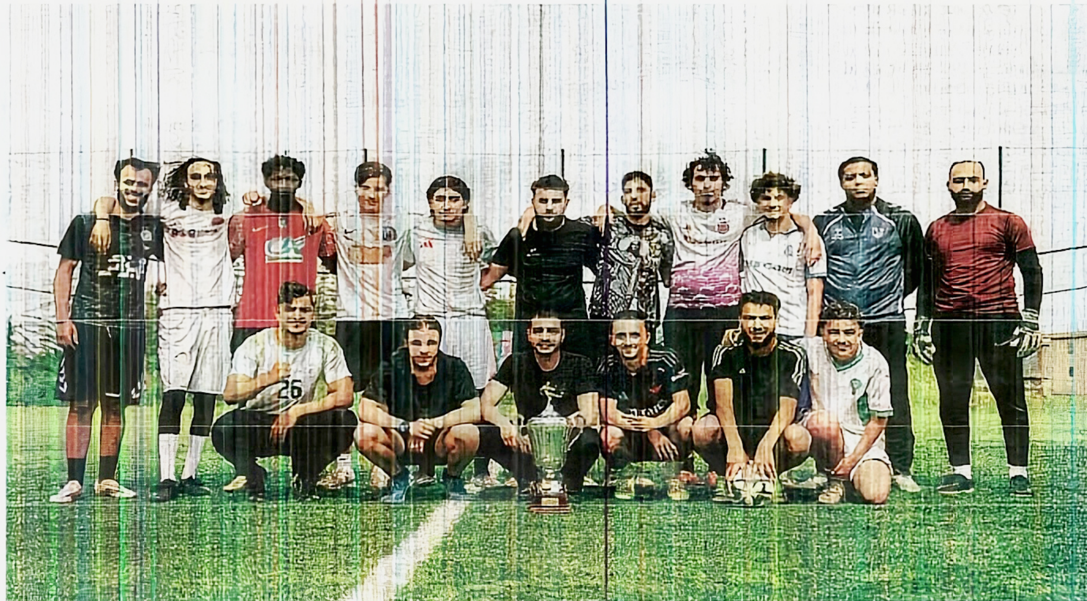
Plus de 70 jeunes ont pris part à un tournoi de foot au profit de sans domicile fixe.

Certaines rencontres bouleversent les membres du collectif, notamment celles de migrants venus en France avec l'espoir d'une vie meilleure. "Ils prennent des