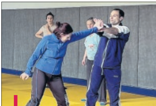
Les femmes ont appris plusieurs techniques et postures pour se défendre.